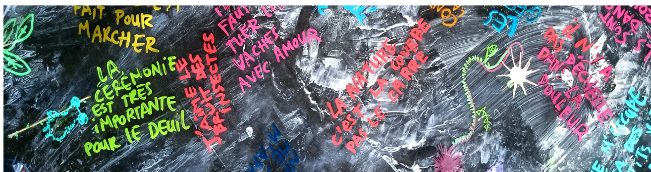
Dessins, extraits du Journal de résidence Se planter là - juin 2022

Les questions traversées entre la plasticienne et des inconnu.e.s au sortir d'un cimetière ou d'une boulangerie se retrouvent alors injectées dans les reliefs mystérieux et hauts en couleurs des jardinières de l'exposition.